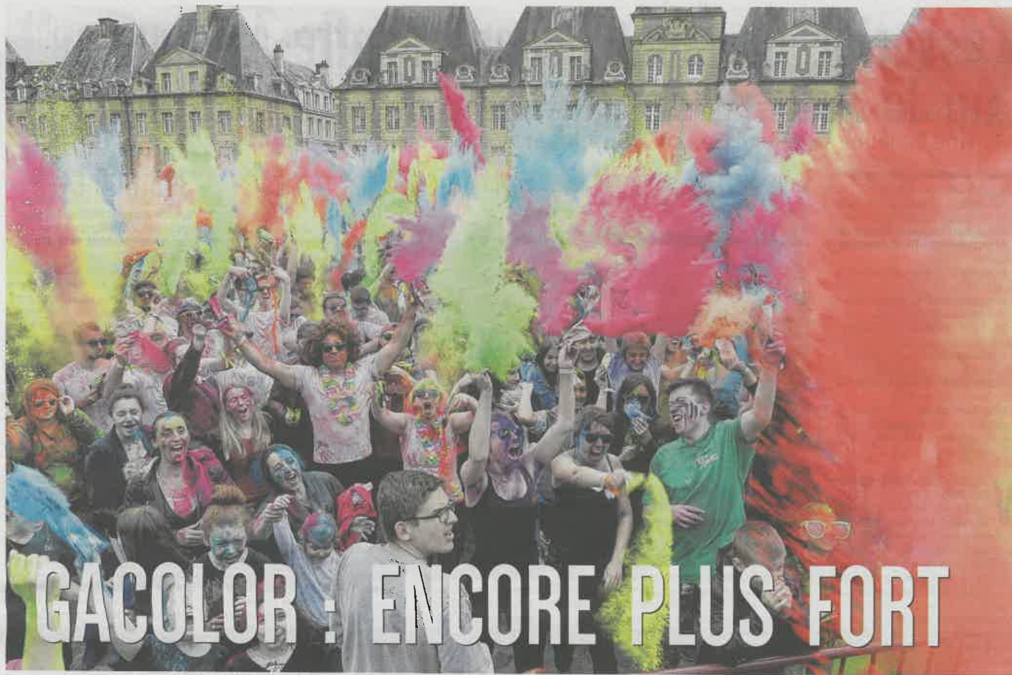
L'année dernière, près de 500 personnes ont coloré la ville de mille couleurs. Cette année, la Gacolor vise le millier de participants.

CHARLEVILLE-MÉZIÈRES Les inscriptions sont ouvertes pour la troisième édition de la Gacolor. Un millier de coureurs multicolores sont attendus le 2 avril prochain.